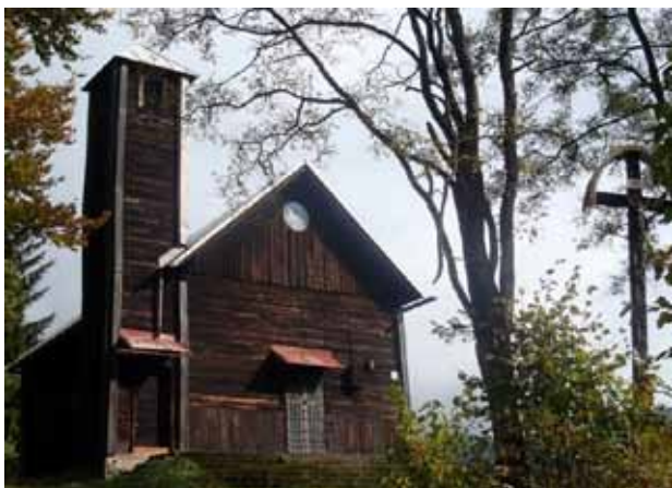
Horná Mariková - Ráztocka - Kaplnka Božieho srdca Ježišovho

Horná Mariková, lying in Javorníky, is still the hallmark of a distinctive community with specific settlement. Preserve it rich folk customs and typical architecture - rustic wooden houses covered with shingle roof.